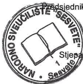
Aida Vidović Krilanović