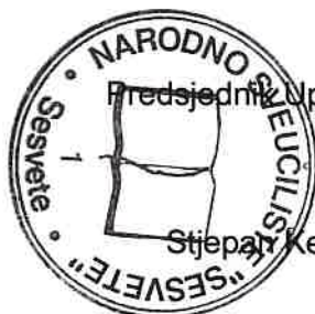
Aida Vidović Krilanović